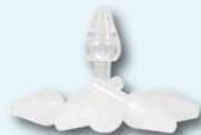
Tratamientos de respiratorio