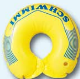
Flotador bañera y piscina